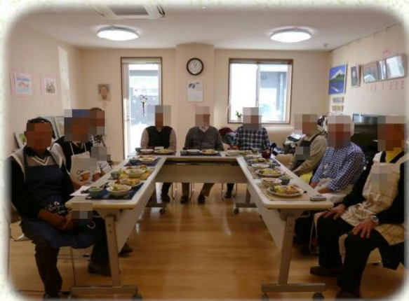
みんなで美味しくいただきました