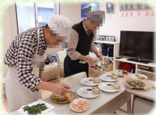
デモンストレーション後、 各担当に分かれて調理を行いました