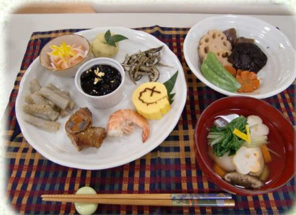
美味しい正月料理が出来ました