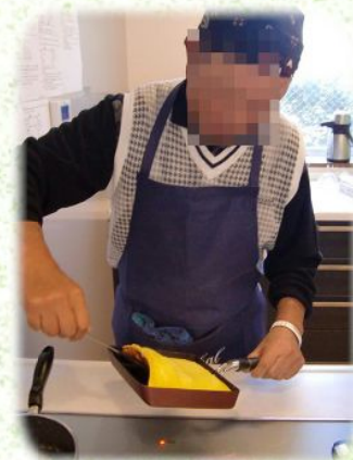
伊達巻もきれいに 焼きました