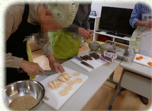
野菜の飾り切りに挑戦